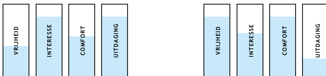
Figuur 2: betrokkenheid voor twee verschillende kinderen, voor twee verschillende activiteiten

en UITDAGING. Deze mix is voor elk kind anders. Elk kind heeft zijn plan, elk kind heeft zijn zin.